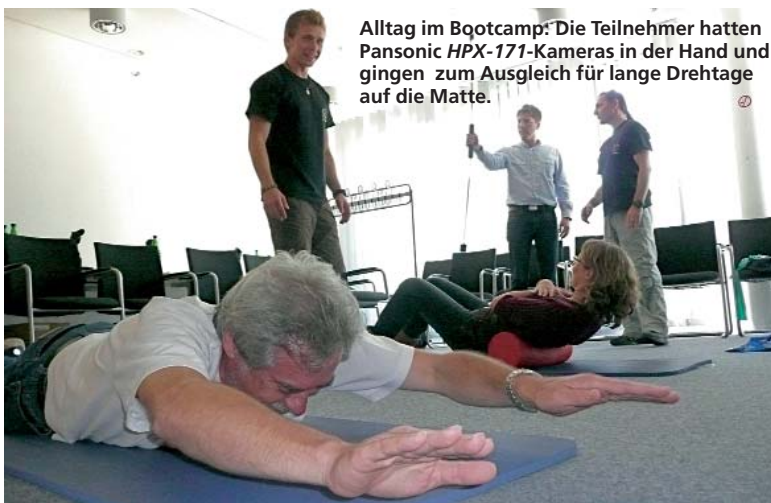
Alltag im Bootcamp: Die Teilnehmer hatten Panasonic HPX-171-Kameras in der Hand und gingen zum Ausgleich für lange Drehtage auf die Matte.